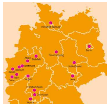
Teilgenommene Kliniken in der Be-Up-Studie